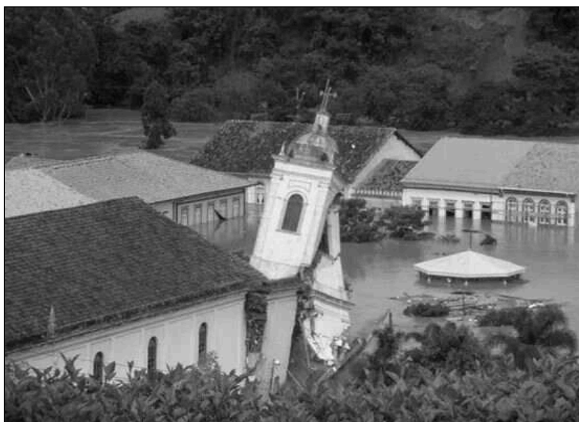
Imagem 1. Torre da Igreja Matriz no momento da queda - foto de 2 de janeiro de 2010

A imagem 1 revela o impacto das águas do rio Paratinga sobre construções do século XIX feitas de taipa de pilão (terra socada). No caso da Matriz, a presença de algumas paredes de alvenaria tornou o prédio ainda mais vulnerável, pois o peso da construção sólida exerceu ainda mais pressão sobre a base de taipa encharcada e transformada em lama.