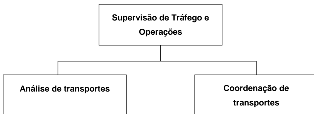
Figura 2 – Organograma da área de transportes

Este grupo de atividades está intimamente ligado ao dia-a-dia da área de distribuição e possui como funções básicas as apresentadas na Figura 2.