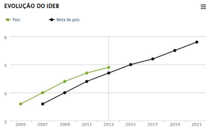
Figura 1 – Evolução do IDEB nos anos iniciais até o ano de 2021