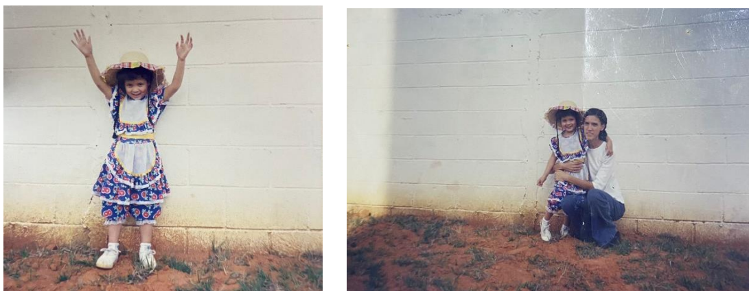
Imagem 4 – À esquerda eu na Festa Junina e à direita com minha mãe