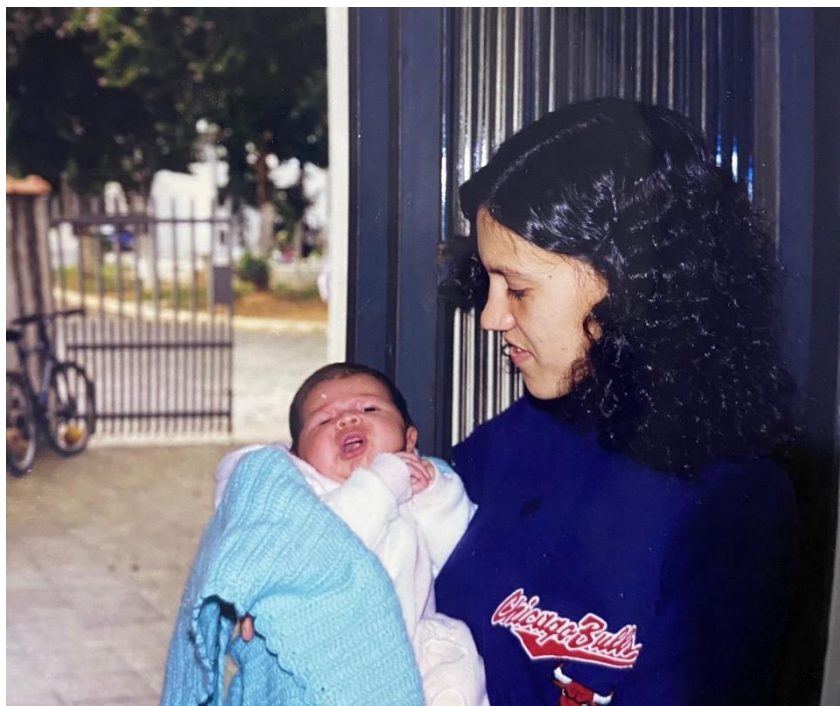
Imagem 1 – Eu no colo de minha mãe

Minha mãe sempre teve um papel essencial na minha vida, pois foi mãe solo desde o meu nascimento, sempre muito zelosa, fez tudo que pode para me dar o que fosse necessário, me educou da melhor maneira e da maneira que ela pode, para que eu crescesse e fosse uma mulher justa, educada e empática com todos.