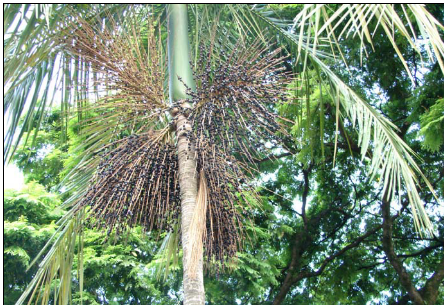
Figura1: Detalhe de Euterpe edulis Mart., apresentando quatro infrutescências

corte de todos os indivíduos das populações nativas de juçara, incluindo as plantas que produzem sementes, ainda é a prática mais comum (REIS & REIS, 2000).